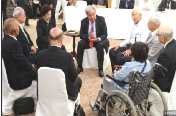
被爆者と懇談する国連事務総長（広島）

唯一の戦争被爆国の政府が、核兵器をなくす先頭に立たず、国連で採択された核兵器禁止条約への署名や批准を拒否する態度に被爆者だけでなく世界からも批判・疑問の声が出ています。こうした姿勢を変えさ